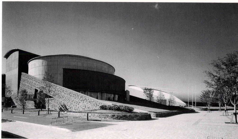
上：ホール棟外観 下：博物館棟外観