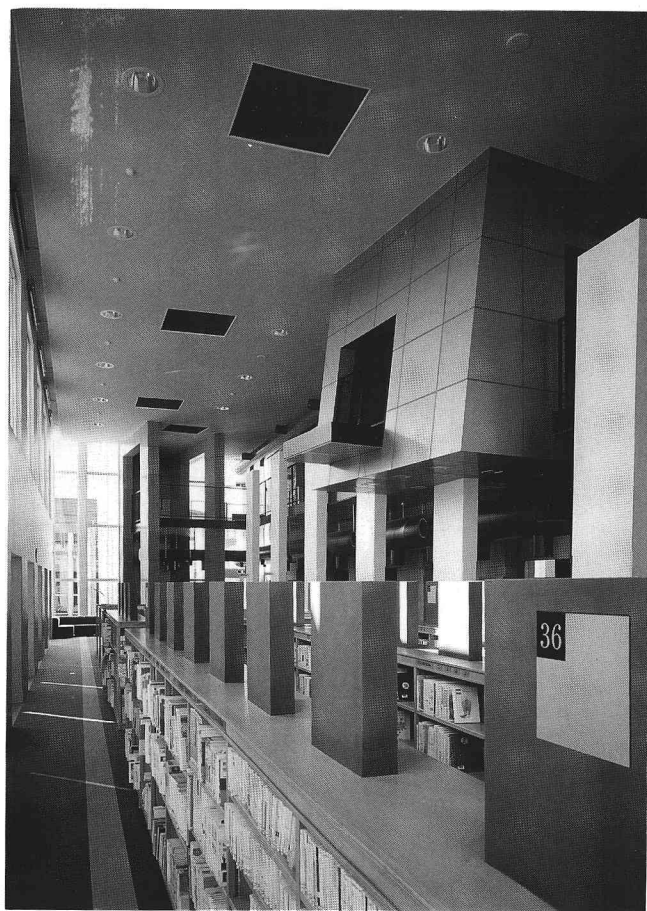
左：アクソメ 右：図書館開架室