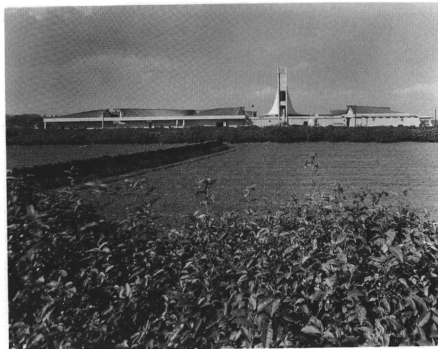
左：研究棟の屋根 右：北側外観 右頁左上：平面(S=1/1400) 右頁右上：屋根伏 右頁下：施工中の屋根